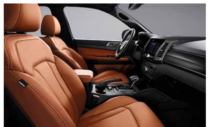
Nyereg barna bőr, fekete tetőkárpittal (OBA)