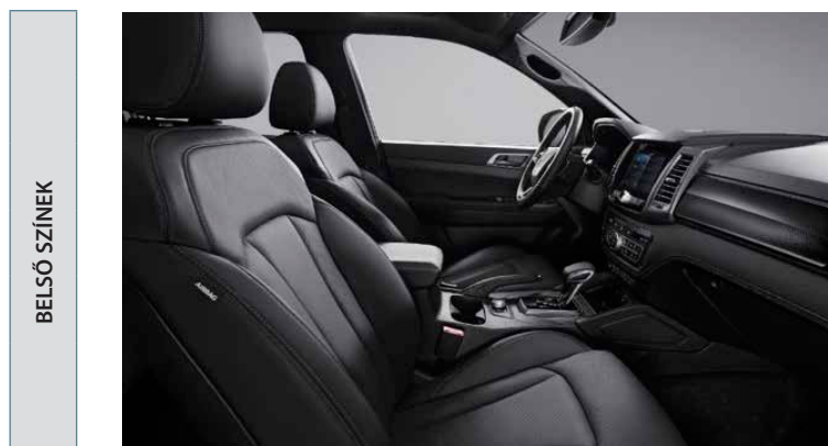
Fekete bőr, fekete tetőkárpittal (LBR)