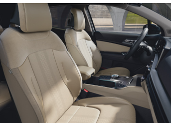
Bőr/Suede üléskárpit Iced Coffee PLATINUM BŐR CSOMAG