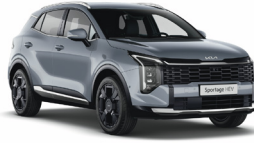
Lunar Silver (Metál)