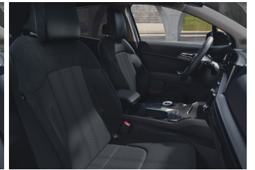
Bőr/Suede üléskárpit Panther Black PLATINUM BŐR CSOMAG