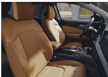
Vegan bőr üléskárpit Gentle Brown PLATINUM VEGÁNBŐR CSOMAG