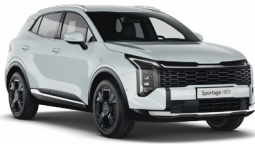
Casa White Alap szín