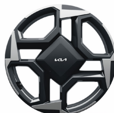
Könnyűfém keréktárcsa 18" D-TYPE /A7/ GOLD STYLE CSOMAG PLATINUM