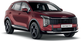
Magma Red (Prémium metál)