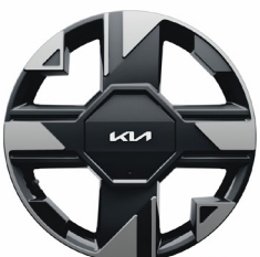
Könnyűfém keréktárcsa 17" D-TYPE /VD/ SILVER ICE