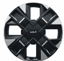
Könnyűfém keréktárcsa 19" D-TYPE /XR/ GT-LINE