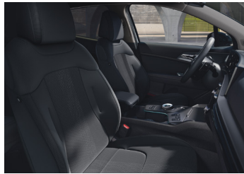
Szövet üléskárpit GOLD