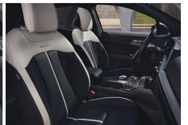
Vegan bőr hát és ülőlap / Suede oldalbetétek GT-LINE ÜLÉS CSOMAG