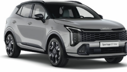
Wolf Grey (Prémium metál)