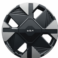
Könnyűfém keréktárcsa 17" E-TYPE /VG/ SILVER HEV/PHEV GOLD ICE/HEV/PHEV