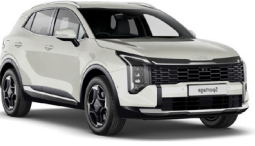
Ivory Silver (Matt - csak PHEV GT-Line verzióhoz)