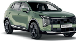
Experience Green (Prémium metál)