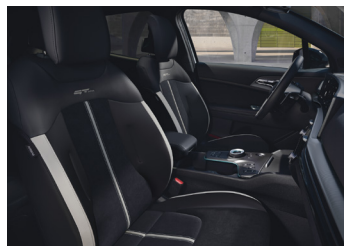
Suede hát és ülőlap / Vegán bőr oldalbetétek GT-LINE