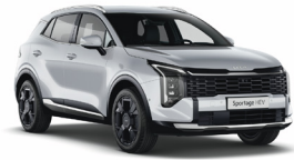
Deluxe White (Metál)