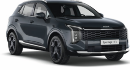
Penta Metal (Metál)