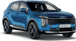
Blue Flame (Prémium metál)