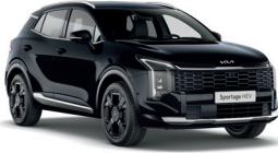
Pearl Black (Metál)