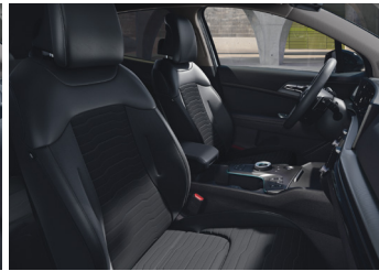
Bőr-szövet üléskárpit GOLD STYLE CSOMAG / PLATINUM